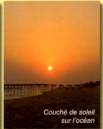
Couché de soleil sur l'océan