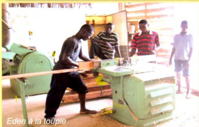
Eden à la touple