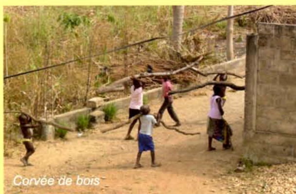
Corvée de bois