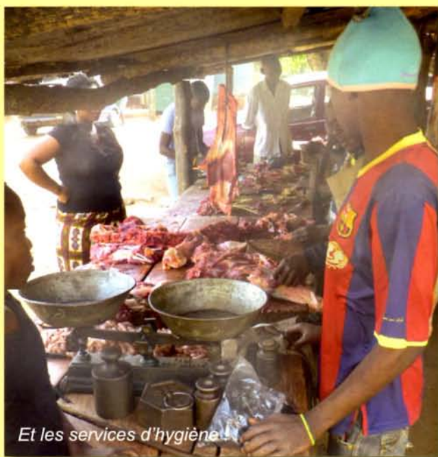
Et les services d'hygiène

La quinzaine de jeunes orphelins qui sont au centre depuis maintenant 4 années sont toujours en contact avec les artisans et chaque jour, vont au travail en faisant une partie du trajet à pied. Ces jeunes vont bientôt terminer leur apprentissage. D'autres jeunes, de 11 à 13 ans, rentreront dans les nouveaux locaux afin d'éviter ces déplacements.