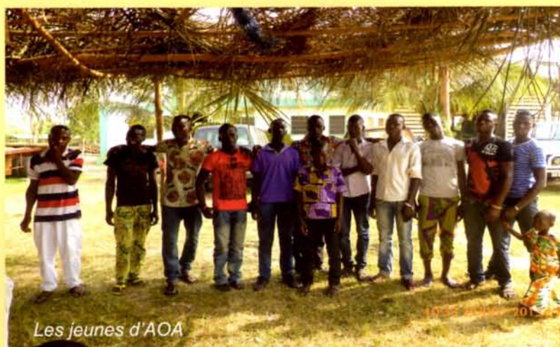
Les jeunes d'AOA