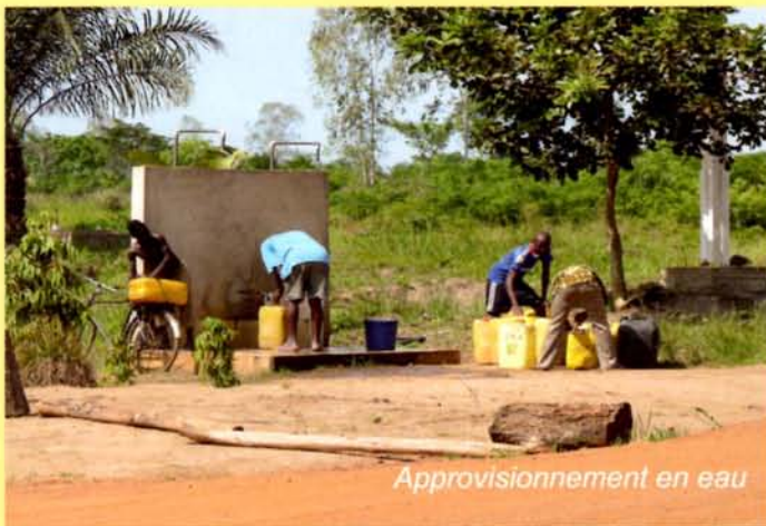
Approvisionnement en eau