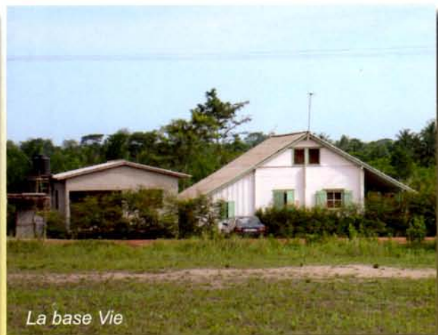
La base Vie