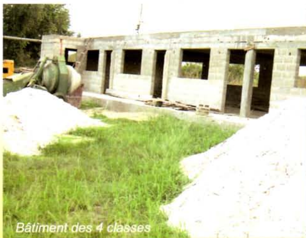
Bâtiment des 4 classes