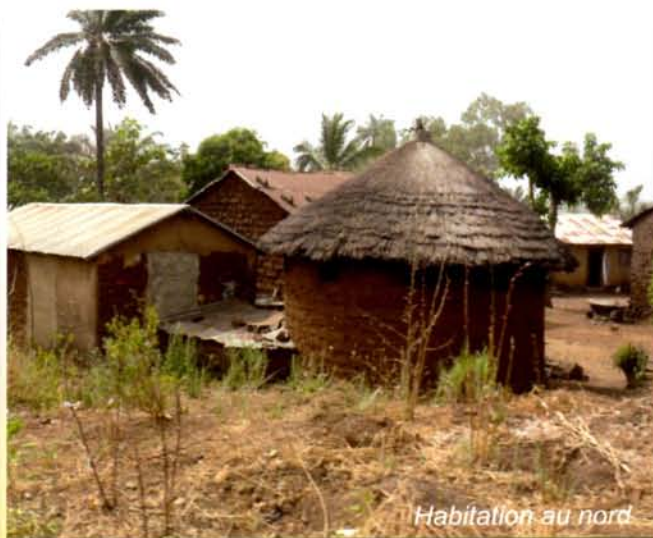
Habitation au nord