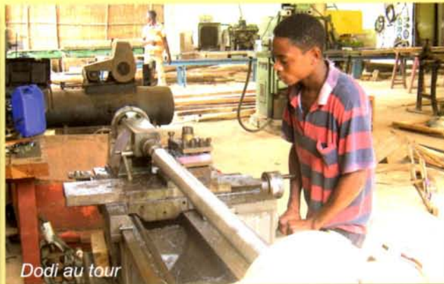
Dodi au tour