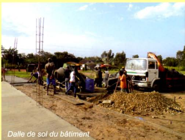
Dalle de sol du bâtiment

L'essentiel est d'avancer ensemble pour le développement et le bien-être de ces gamins délaissés.