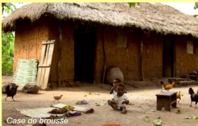
Case de brousse

La prochaine étape sera la finition des classes, la construction du dortoir, l'aménagement du magasin pour l'atelier, la construction d'une petite porcherie pour 6 à 8 cochons.