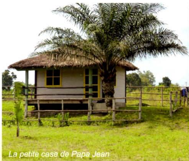
La petite case de Papa Jean