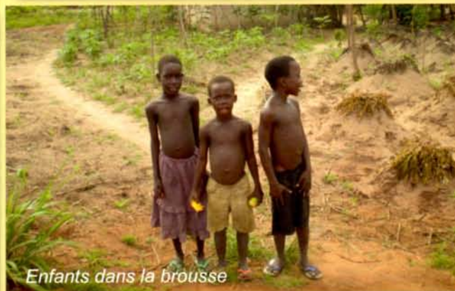
Enfants dans la brousse