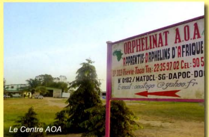
Le Centre AOA