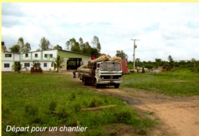
Départ pour un chantier

Le Ministère de la Santé met l'accent sur les vaccinations et les soins apportés aux enfants.