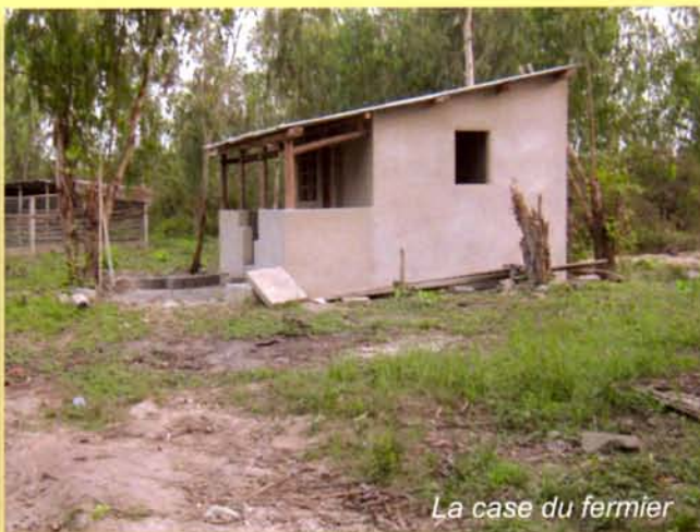
La case du fermier